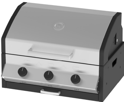
MERIDIAN 3 98223I