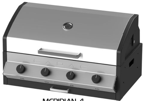
MERIDIAN 4 98224I